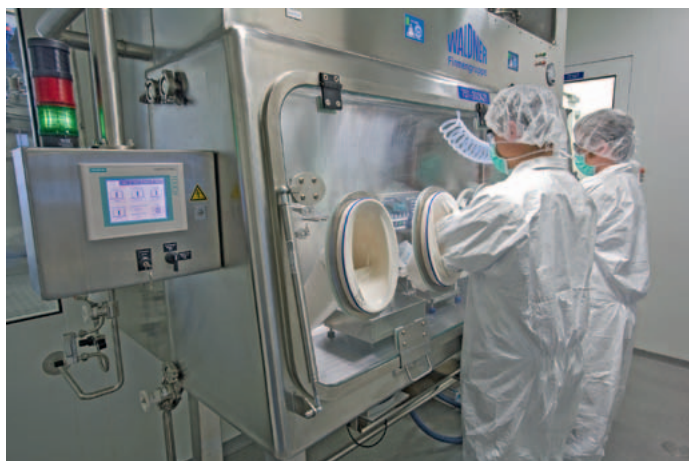
Potent-Compound-Produktion bei der Lonza AG am Standort Visp.

T-DM1 basiert auf einer Linker-Technologie, welche von Immunogen entwickelt wurde. Roche hat dafür eine Lizenz erworben. Diese Technologie nutzt im Gegensatz zu Aurostatinen, welche für Seattle Genetics verwendet werden, Maytansionide als Zytotoxin. T-DM1 basiert auf jenem Antikörper, der für das erfolgreiche Medikament Herceptin ® verwendet wird. Roche generiert mit Herceptin ® einen jährlichen Umsatz von über CHF 4 Mrd. T-DM1 hat dabei durchaus das Potential, Herceptin ® mit der Zeit abzulösen, wodurch ersichtlich ist, dass dieser Wirkstoff ein riesiges Marktpotential hat. Ein Antrag für ein beschleunigtes Zulassungsverfahren basierend auf Phase-II-Resultaten wurde