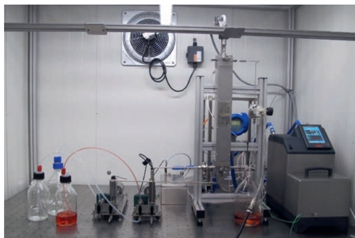
Fig. 1: Fluitec reaction calorimeter setup.

The Fluitec continuous reaction calorimeter comprises two flow-controlled dosing systems, one jacketed tubular reactor with static mixers inside, one axial temperature sensor, temperature sensors for the heat transfer medium side as well as a precise thermostat (Fig. 1). The equipment is available in stainless steel and in Hastelloy.