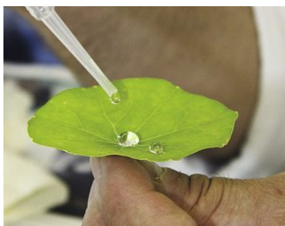
Der Lotus-Effekt auf Oberflächen mit Nanostruktur.