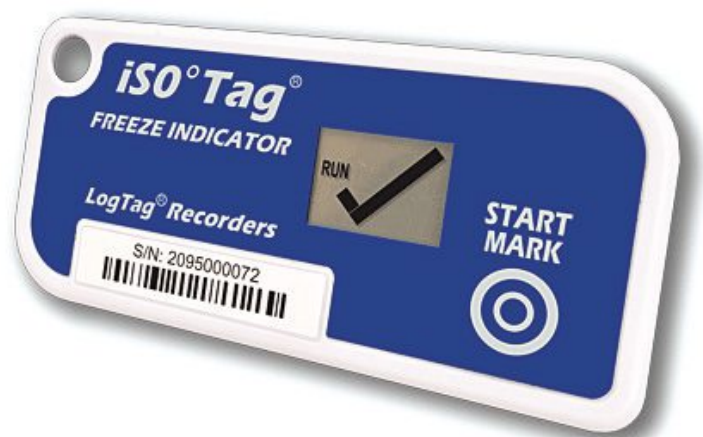
Gefrier-Indikator TICT-iSO°Tag® der Serie LogTag®