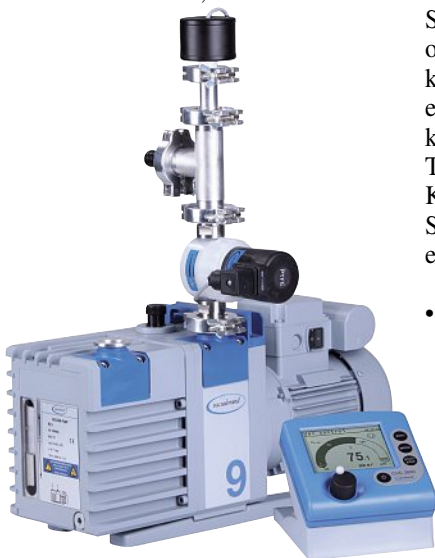
Feinvakuum-Regelpaket (Pumpe nicht im Lieferumfang)