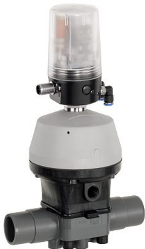
Ventilanschalung GEMÜ 4242 auf dem Kunststoff-Membranventil GEMÜ R690

Green Engineering ist bei GEMÜ Programm. Die zukunftsorientierte Firmenphilosophie bringt Kunden gleich zweifach wirtschaftliche Vorteile: Im Einkauf durch wettbewerbsfähige Preise, aber auch bei der Montage und beim Funktionsumfang. Die Pneumatik- und Elektroanschlüsse der Ventilanschalung etwa sind platzsparend und leicht zugänglich in eine Richtung positioniert. Sie lässt sich dadurch schnell und einfach ohne grossen Kabelaufwand montieren und auch bei der Wartung gibt es keine Probleme. Darüber hinaus wird die Montage und Inbetriebnahme durch eine speed-AP-Funktion vereinfacht, eine Handhilfsbetätigung erlaubt einen schnellen Membranwechsel. Das alles spart Zeit und damit Geld und senkt zudem den Planungsaufwand. GEMÜ 4242 integriert darüber hinaus Funktionen, die weiteres Zubehör überflüssig machen. So arbeitet die Ventilanschalung mit einer mikroprozessorgesteuerten, intelligenten Stellungserfassung und einem analogen, integrierten Wegmesssystem.