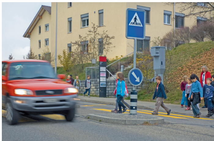
Verkehrsüberwachungsanlagen (im Hintergrund ein Laserscanner) sind eine sehr wirksame Massnahme zur Verhinderung von Verkehrsunfällen.

Jedes Jahr verunfallen im Schweizer Strassenverkehr etwa 100 000 Personen; rund 360 Personen werden getötet. Eine der häufigsten Unfallursachen ist das Fahren mit überhöhter Geschwindigkeit. Gezielte Geschwindigkeitskontrollen an kritischen Stellen erhöhen die Verkehrssicherheit. Messgeräte, die zur Überwachung von Geschwindigkeit und Lichtsignalen eingesetzt werden, müssen eine sehr hohe Zuverlässigkeit aufweisen: Die Verkehrsteilnehmerinnen und -teilnehmer sowie Polizei und Gerichte müssen sich auf die gemessenen Werte verlassen können. Dies sicherzustellen ist Aufgabe des Bundesamtes für Metrologie (METAS).