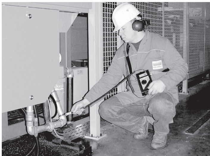
Leckageortung im MHP-Werk Burbach

Welche Optimierungspotenziale bietet eine gepflegte Druckluftstation und -verteilung? Diese Frage stellten sich die Verantwortlichen im Werk Burbach der Mannesmann Hoesch Präzisrohr GmbH (MHP), das pro Jahr rund 30 000 Tonnen nahtlose Präzisionsrohre mit Durchmessern von 16 bis 90 mm herstellt. Sie erarbeiteten vor