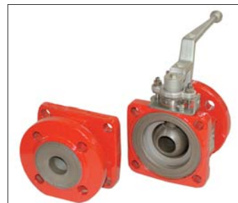
Kugelhahn Baureihe KN/F-P, demonstriert, mit Auskleidung aus PFA-P

Der Kugelhahn KN/F-P, DN 25 mit Auskleidung PFA-P, wurde testweise als Alternative zu Spezialarmaturen aus Sonderwerkstoffen eingesetzt und zeigt auch nach 1,5 Jahren Dauereinsatz keinerlei Ausfallerscheinung, ist aber wesentlich preisgünstiger.