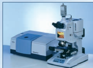
TENSOR 27 das leistungsfähige FT-IR-Spektrometer mit HYPERION FT-IR-Mikroskop