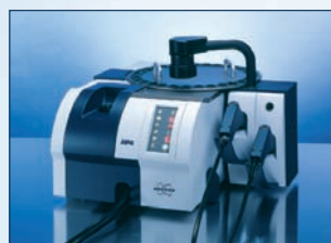
MPA FT-NIR-Spektrometer für die Methodenentwicklung und Qualitätskontrolle