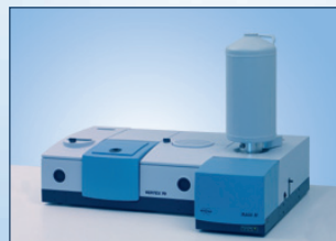
VERTEX 70 flexibles FT-IR-Spektrometer für F&E-Anwendungen mit RAM II FT-Raman-Modul