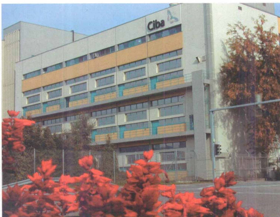
Fig. 2. Betrieb WS-2094