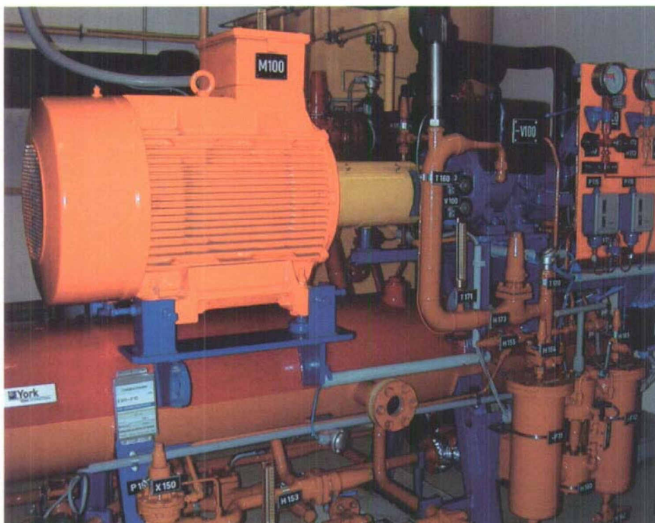
Fig. 4. POLARIS (Kühlsystem)