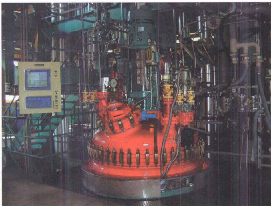
Fig. 3. Reaktor 4000 Liter im WS-2090.3

le Kampagnengröße bei der Kleinfabrikation das wichtigste, um genügend Kapazitäten für eine Entwicklung aufrechtzuerhalten. Die kostengünstigste Kampagnengröße wird in Funktion von verschiedenen Parametern wie Marktnachfrage, Lagerkosten und Umrüstkosten eruiert. Die Produktion grosser Mengen liefert Vorteile wie Reduktion der Fehler durch Lerneffekte, stabilere Qualität und Reduktion der Produktionskosten. Einige