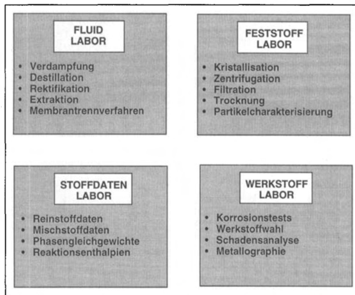
Fig. 3. Die Aufgabebereiche der Speziallabors

Unser Werkstofflabor ist das einzige seiner Art im Roche-Konzern. Die beiden Hauptaufgaben des Werkstofflabors bestehen in der Vermeidung von Korrosionsschäden durch die Wahl von geeigneten Apparatwerkstoffen sowie in der Ermittlung der Ursachen bei aufgetretenen Korrosionsschäden. Zur Erfüllung dieser Aufgabe werden Abtragsgeschwindigkeiten mittels Tauchversuchen und elektrochemischen Methoden gemessen. Im weiteren stehen zerstörungsfreie Prüfmethoden wie zum Beispiel Endoskop-Sichtprüfungen und Ultraschall-Wanddickenmessungen zur Verfügung. Zusätzlich werden Korrosionsuntersuchungen vor Ort durchgeführt, indem bei laufenden Pilotierun-