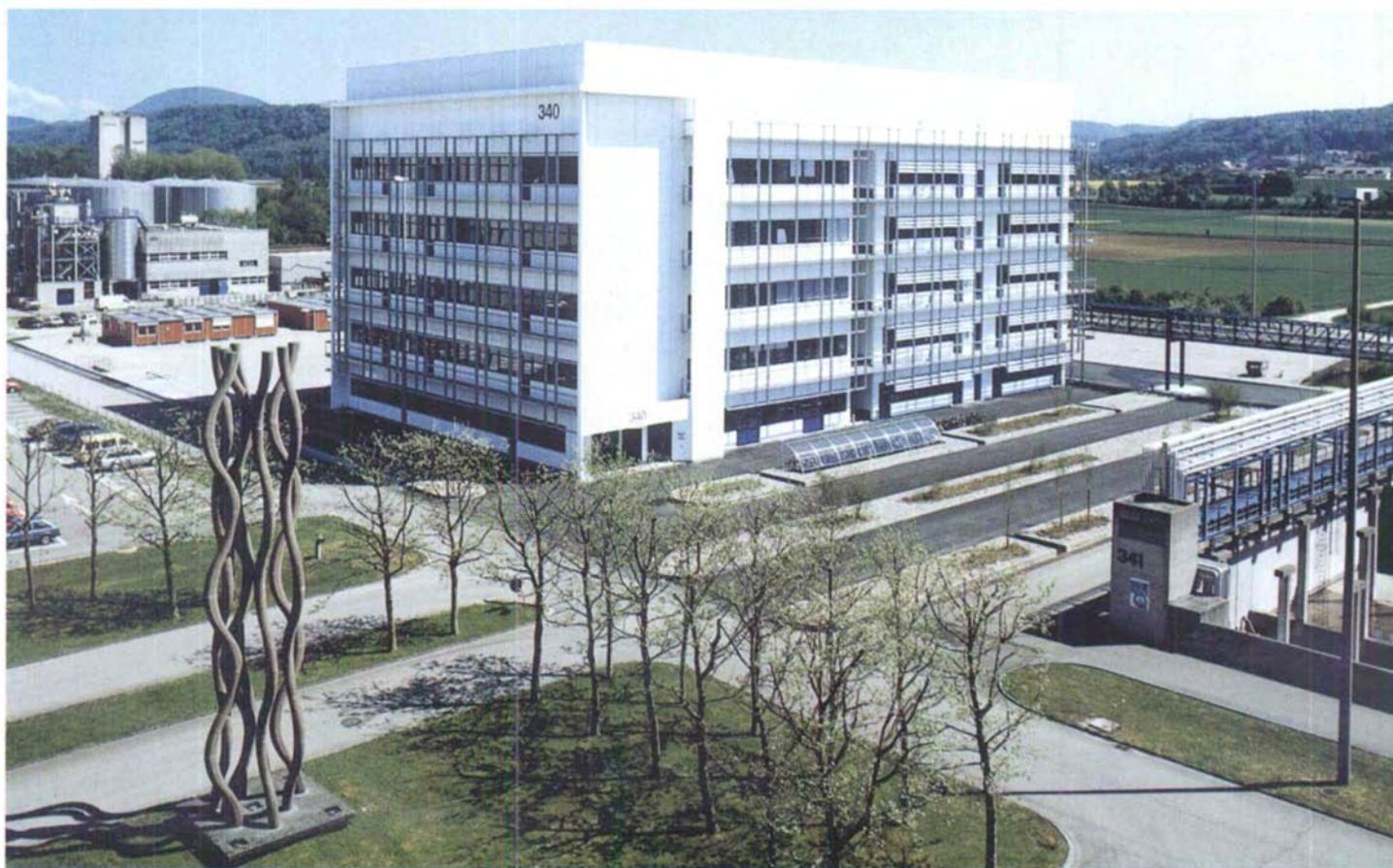
Fig. 1. Das neue Vitamin Tech Center im Roche-Werk Sisseln

*Korrespondenz: Dr. M. Hugentobler Process Development Roche AG CH-4334 Sisseln