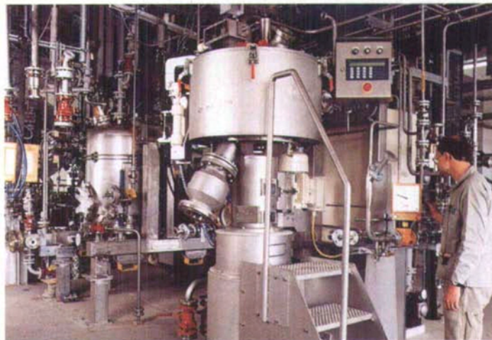
Fig. 6. Scale-up einer Feststoffabtrennung mittels Pilotzentrifuge

gen zur Auswahl stehende Werkstoffmuster in den Reaktor eingebaut und anschliessend optisch und gravimetrisch ausgewertet werden.