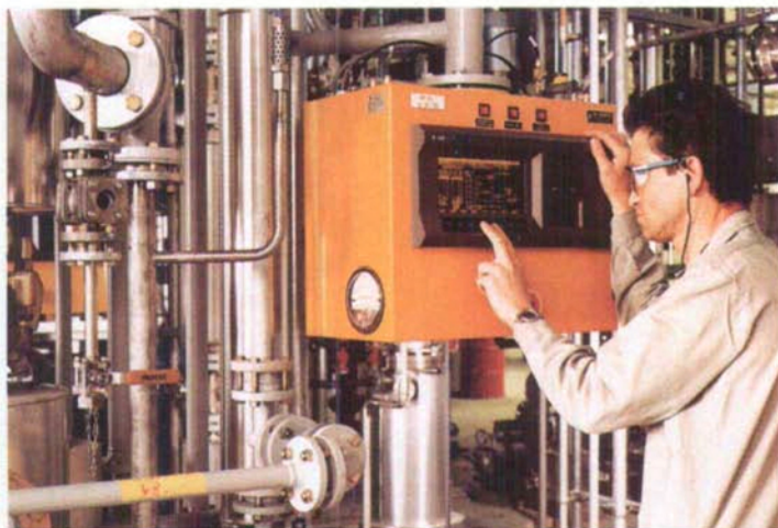
Fig. 5. Die Apparate der Pilotanlage werden über ein Prozessleitsystem vor Ort gesteuert