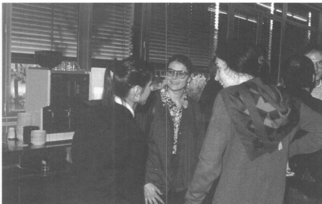
Fig. 2. Les retrouvailles à l'heure du café

qu'elle occupera 20 ans, elle n'a, depuis lors, cessé de se développer au point de devenir un centre de formation et de compétence pour les industries chimiques cantonales, romandes et même de la Suisse entière.