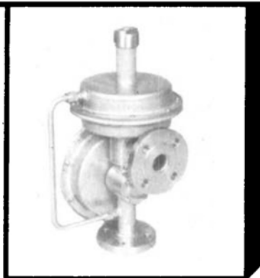
LPS/LPL- KOMBINATION ÜBERSTRÖM/UNTER- DRUCKVENTIL

(auch in Kunststoffaus- führung erhältlich)