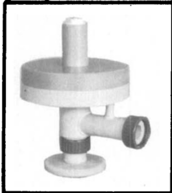
ÜBERSTRÖM- VENTIL TYP LPS 25

Wir senden Ihnen gerne detaillierte Unterlagen