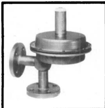
NIEDER- DRUCKREGLER TYP LPR 25 UNTER- DRUCKREGLER TYP LPR/N

○ Membrane u. Sitz in Viton oder PTFE ab 4 mbar